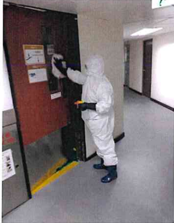
寫字樓公眾走廊消毒