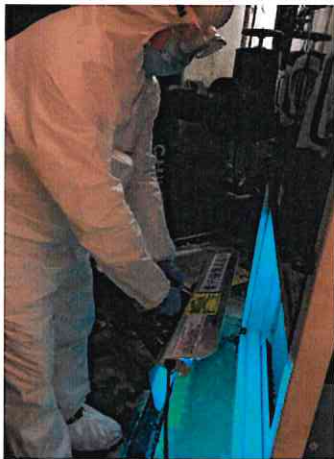
紫外光消毒冷氣系統